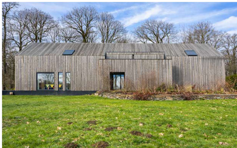
Habitation à Bouillon (Architecte : Marie le Clément)