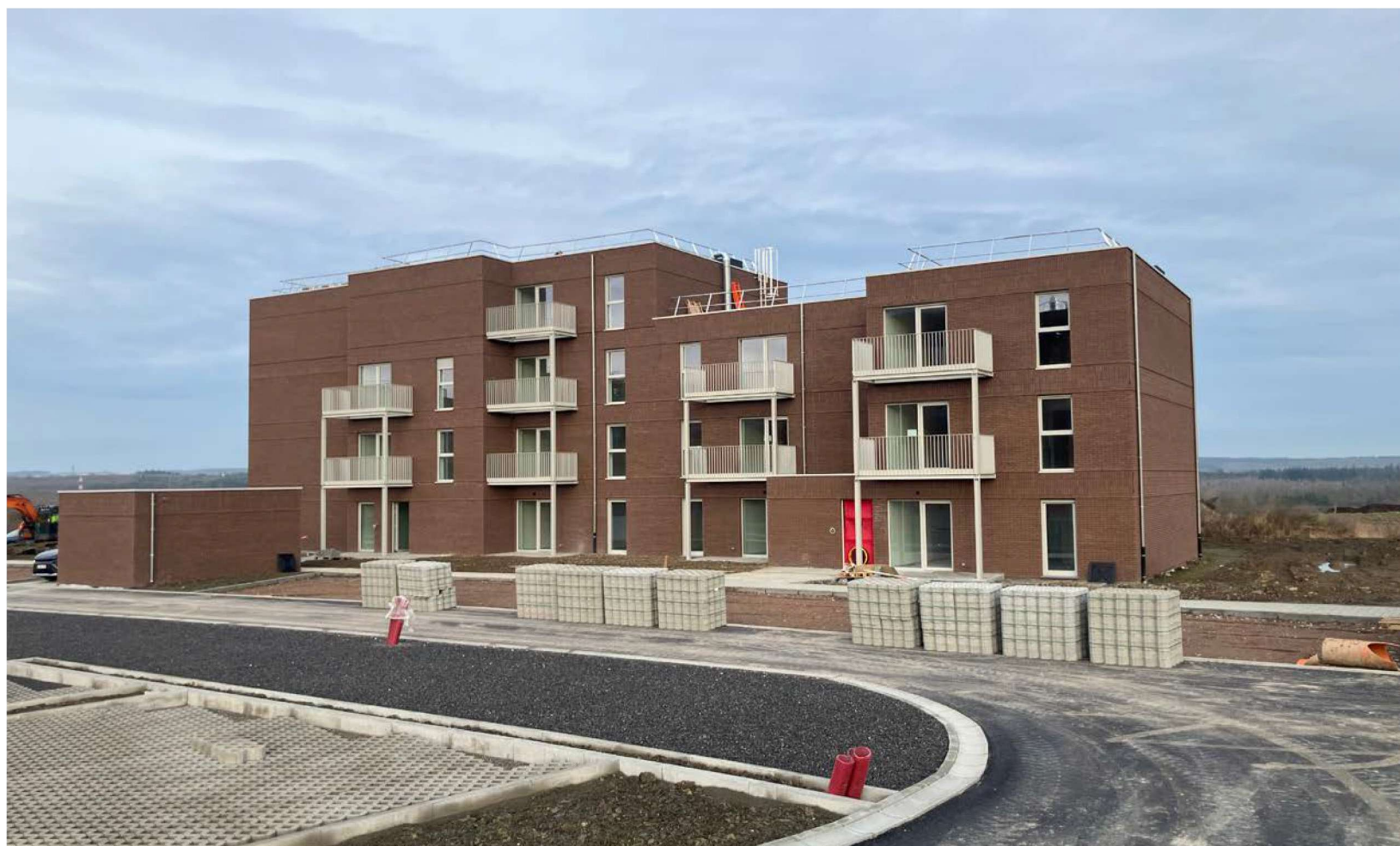
Logements collectifs à Marche (Architecte : Jourdain Architectes Associés – Entreprise : Galère – Maître d'ouvrage : SRL La Famennoise/subside européen SWL)