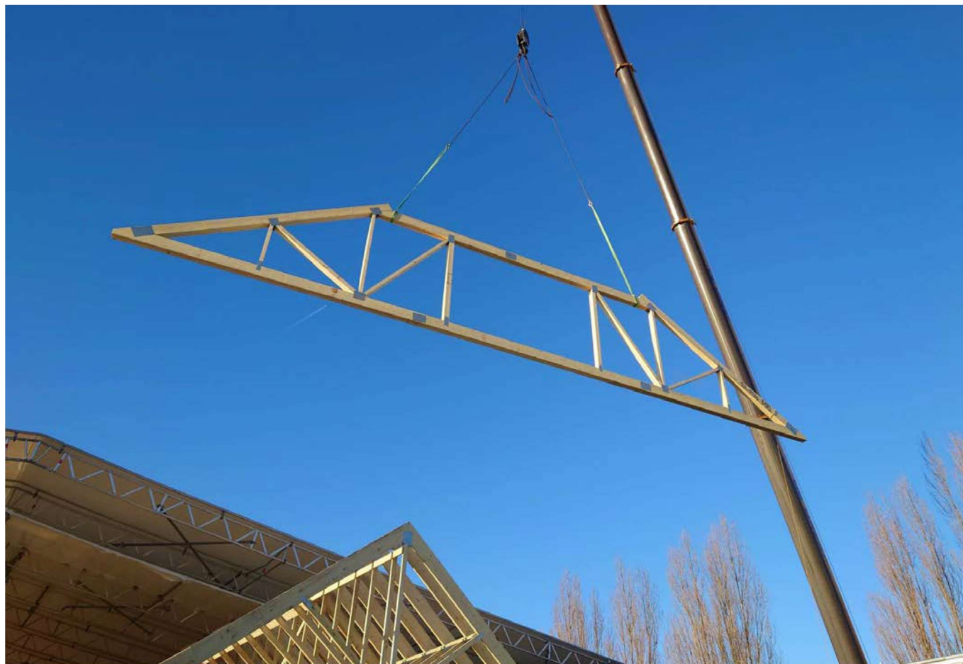
Fondée en 2002, l'entreprise spécialisée en construction bois s'est diversifiée au fil des années

clientèle très large, allant du simple curieux non initié à la construction bois, à la personne la plus informée ayant déjà un projet très précis en tête, voire en cours de route ».