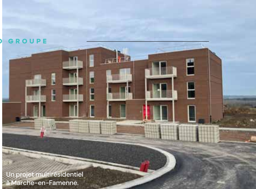
Un projet multirésidentiel à Marche-en-Famenne.