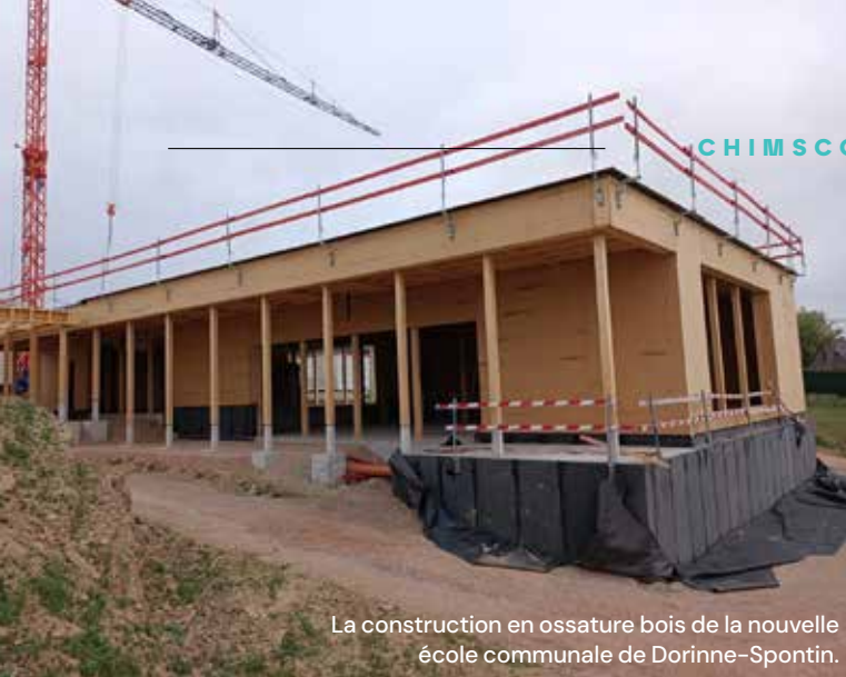
La construction en ossature bois de la nouvelle école communale de Dorinne-Spontin.